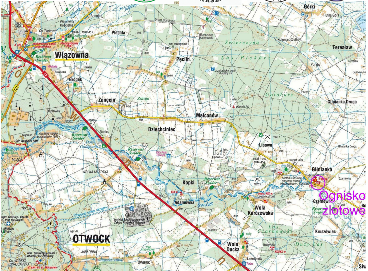
Fragment mapy turystycznej wydawnictwa Compass