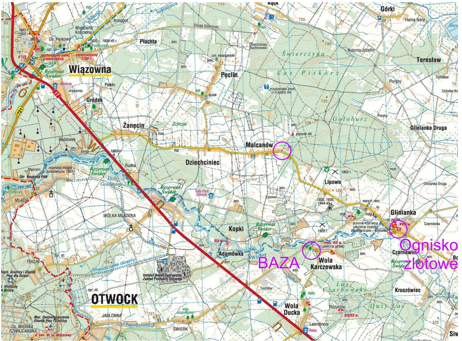
Fragment mapy turystycznej wydawnictwa Compass